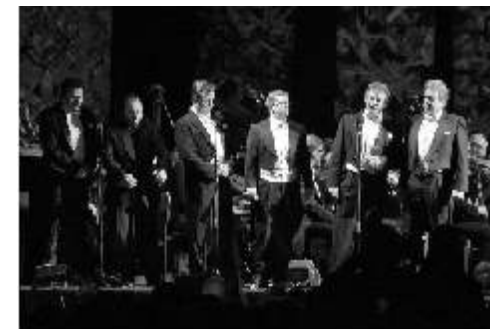
Turniej Tenorów w Teatrze pod Blachami otwierający Festiwal wywołał ogromny aplauz publiczności.